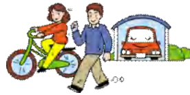
スマート通勤手段 (キャンペーン期間合計) (n=1715人・日)

また、 約4割のサポーターが、自分で立てた目標をクリア できたと回答がありました。